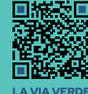
LA VIA VERDE