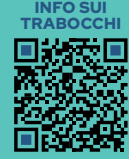
INFO SUI TRABOCCHI